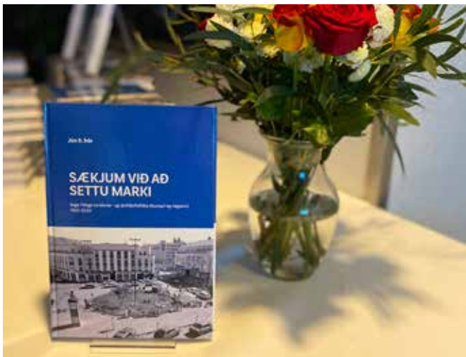
Saga félagsins, Sækjum við að settu marki.

Bókin er öllum aðgengileg rafrænt og sem hljóðbók þeim að kostnaðarlausu á vef félagsins. Auk þess geta áskrifendur hjá Storytel hlustað á bókina þar.