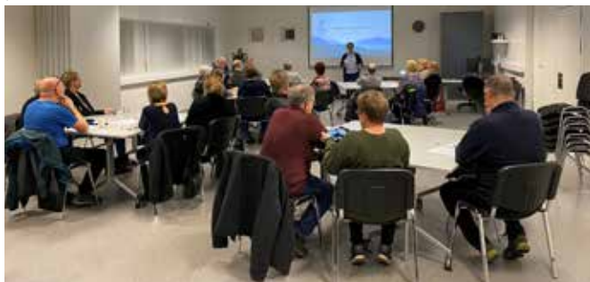
Frá starfslokanámskeiði í SÍMEY.

Í nóvember bauð FVSA félagsmönnum að sækja starfslokanámskeið sem félagið hélt í samstarfi við SÍMEY. Námskeiðið samanstóð af fræðslu um lífeyrissjóði og sjúkratryggingar, andlegar og félagslegar hliðar þess að láta af störfum ásamt kynningum frá SÍMEY, Félagi eldri borgara, Akureyrarbæ og FVSA. Alls mættu 27 félagsmenn, þar af fjórtán konur og þrettán karlmenn. Vel var látið af námskeiðinu og sögðu þátttakendur það bæði upplýsandi og gagnlegt.