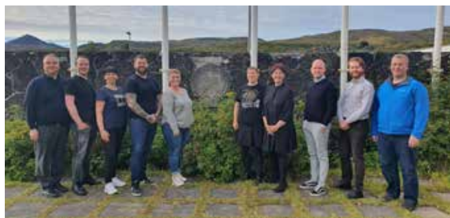
Frá Bifröst þar sem FVSA átti tvo fultrúa.