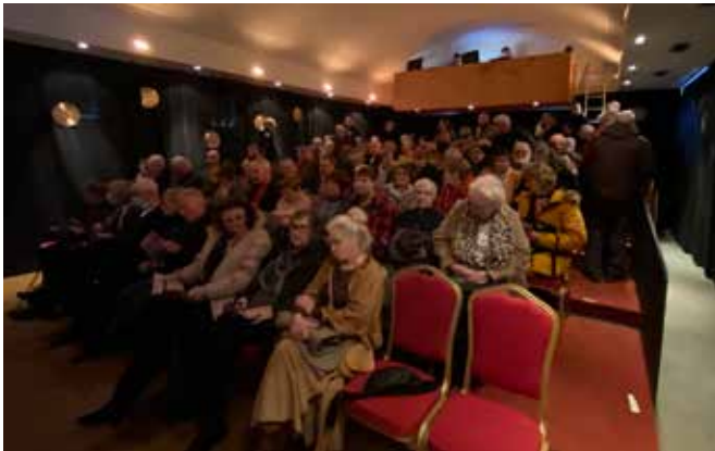
Leikhúsgestir saman komnir að Melum.

Alls mættu 96 þrúðbúnir félagsmenn og sameinuðust í rútur við Alþýðuhúsið. Ferðin hófst á kaffisamsæti á Þelamörk og eftir að allir höfðu gætt sér á dýrindis veitingum var haldið að Melum. Við tók lífleg og hressandi sýning sem byggir á lögum Bjartmars Guðlaugssonar, en persónur leikritsins spretta ljóslifandi fram á sviðinu úr textum hans.