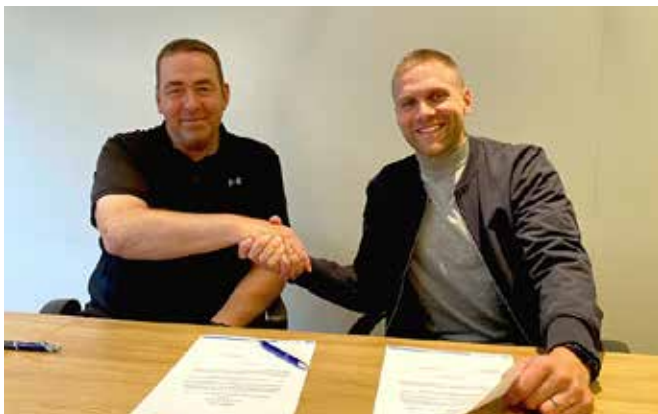
Frá undirritun samningsins við Niceair.

Á árinu voru greiddir 116 orlofsstyrkir að upphæð 26.000 kr. hver styrkur, en í heildina greiddi félagið orlofsstyrki til félagsmanna fyrir 3.065.600 kr.