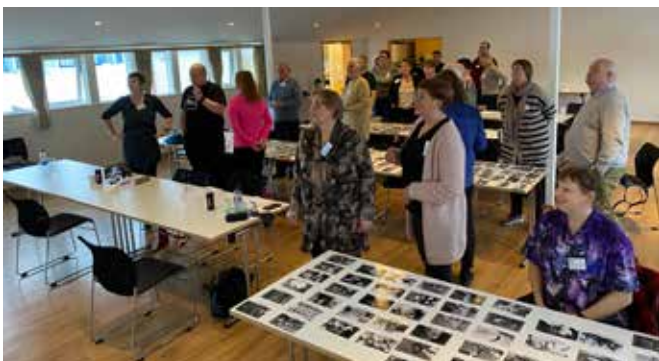
Frá vinnustofu um styrkleika á starfsdegi trúnaðarmanna.