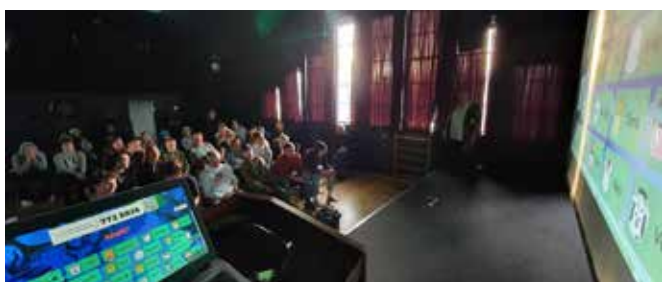
Nemendur í Glerárskóla tóku vel á móti starfsfólki FVSA.

Á haustmánuðum fóru starfsmenn FVSA í heimsókn í grunnskólana á Akureyri og héldu kynningar um réttindi og skyldur á vinnumarkaði fyrir 10. bekk. Tilgangur heimsóknanna er að hvetja ungt fólk til þess að vera meðvitað um réttindi sín og skyldur, vera vakandi fyrir eigin hag, m.a. með því að þekkja megininntak kjarasamninga, launataxta, vinnutíma og veikinda- og orlofsrétt. Einnig að kynna þjónustu stéttarféлага, helstu sjóði og styrki ásamt því að hvetja krakkana til þess að leita til síns félags með spurningar.