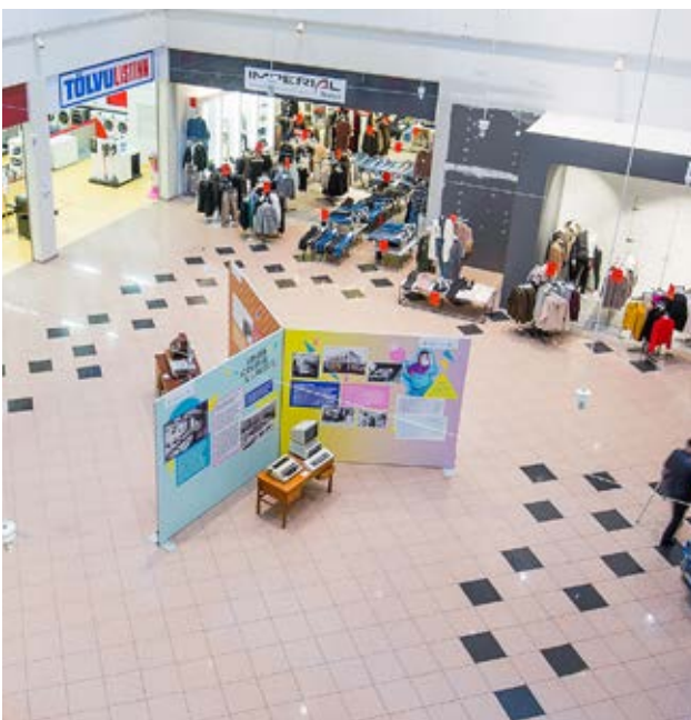
Afmælissýning FVSA á Glerártorgi.