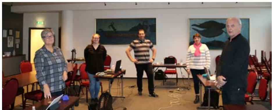
Þingfulltrúar FVSA á þingi ASÍ