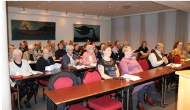
Frá aðalfundi FVSA