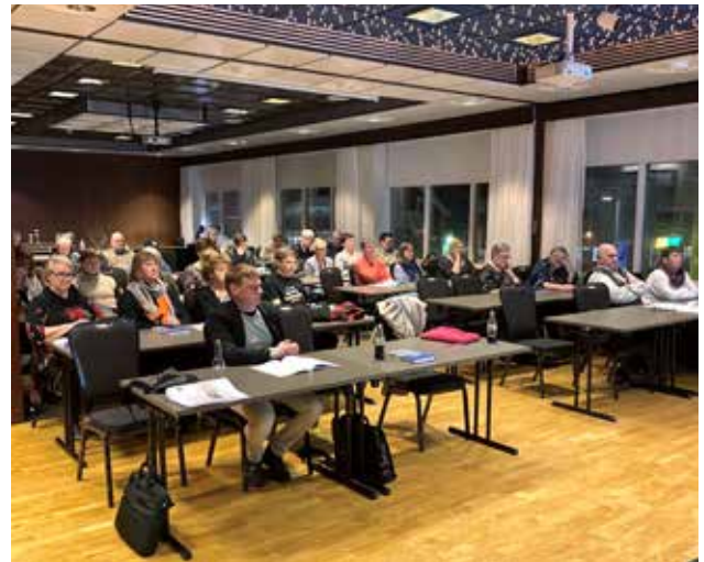
Fundurinn var haldinn í sal Múlabergs á Hótel Kea.