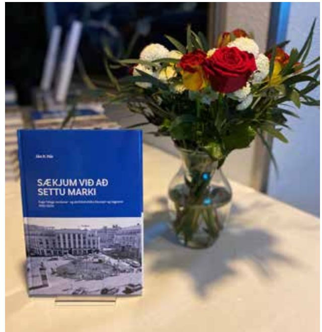
Saga FVSA 1930-2020 komin út.